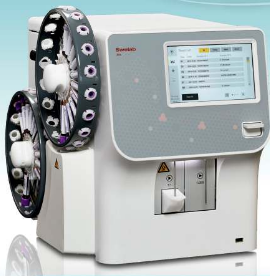
Swelab Alfa Plus Sampler 3 Diff · Carrousel · Adaptador MPA

Se necesitan más investigaciones futuras para un mejor conocimiento de las vías de activación y las actividades superpuestas de los diferentes IFN.