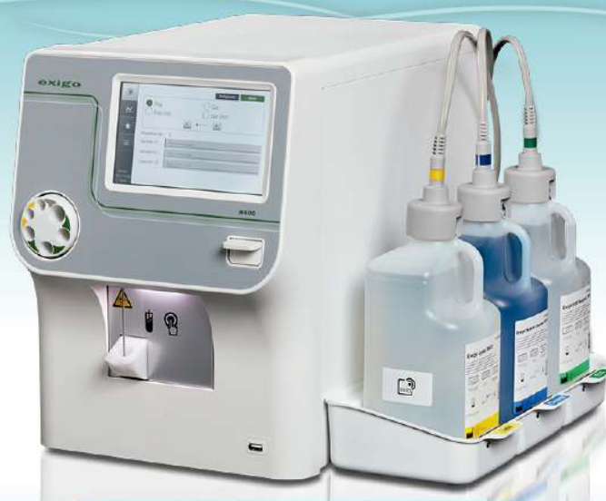
exigo H400 Uso veterinario · 4 Diff · Adaptador MPA