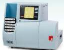
Orphee Mythic 22 AL Total Automático 5 DIFF + Bioseguridad