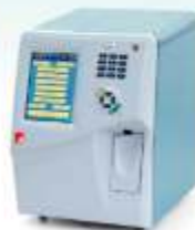
Orphee Mythic 22 OT 5 DIFF + Sistema Tubo Abierto