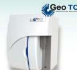
Bioseguridad - Sistema Tubo Cerrado PC + Monitor + Impresora Conexión a LIS