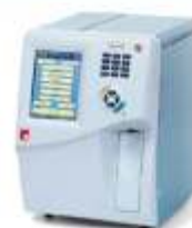
Orphee Mythic 18 3 DIFF + Sistema Tubo Abierto