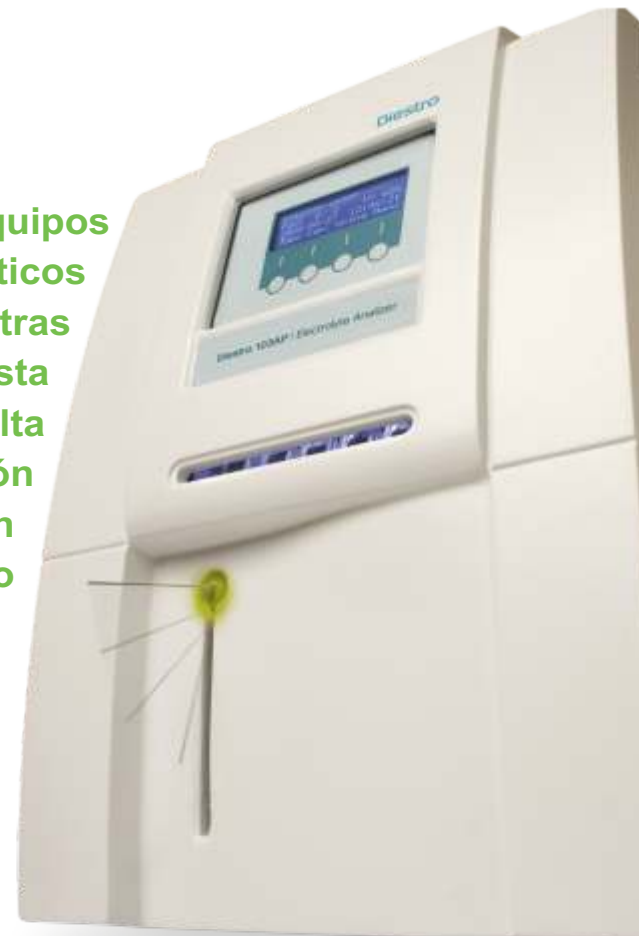
DIESTRO 103 AP

Desde equipos semiautomáticos para pocas muestras diarias, hasta automáticos de alta gama y prestación para una gran carga de trabajo